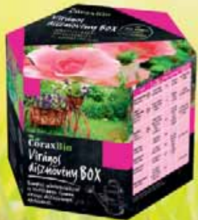
Virágos dísznövény BOX