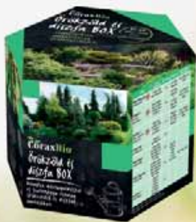
Örökzöld és díszfa BOX